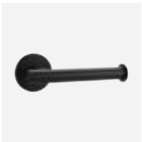
WC-Papierhalter / Reservepapierhalter