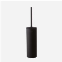
WC-Bürstengarnitur mit Deckel